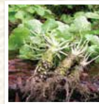
菊地わさび園 山梨県都留市夏狩1803 ☎0554-43-9279 駐車場:有

菊地わさび園は豊富な湧水を利用し、ダンディなご主人が都留市特産のわさびを無農薬で栽培しています。予約すれば、畑で採れた新鮮なわさびや「わさび漬」をその場で購入することができます。畑見学や収穫体験もできるので連絡してみてください。