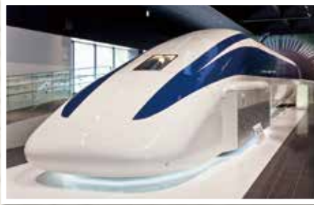
時速581キロを記録した車両(実物展示)

山梨県立リニア見学センター *リニア走行試験が行われていない日もあります。スケジュールは見学センターHPにてご確認ください。 山梨県都留市小形山2381 ☎0554-45-8121 駐車場:有